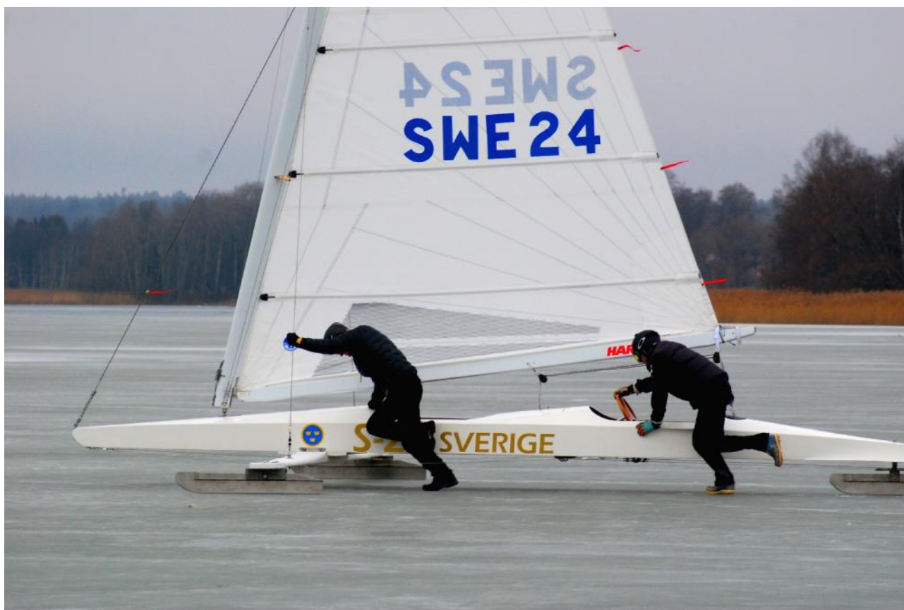
Fysingen den 22 januari 2017.

Säsongens start var den 14 januari på Fysingen där flera träningsseglingar genomfördes under januari och början av februari. Aktiviteten var därför låg inom sällskapet.