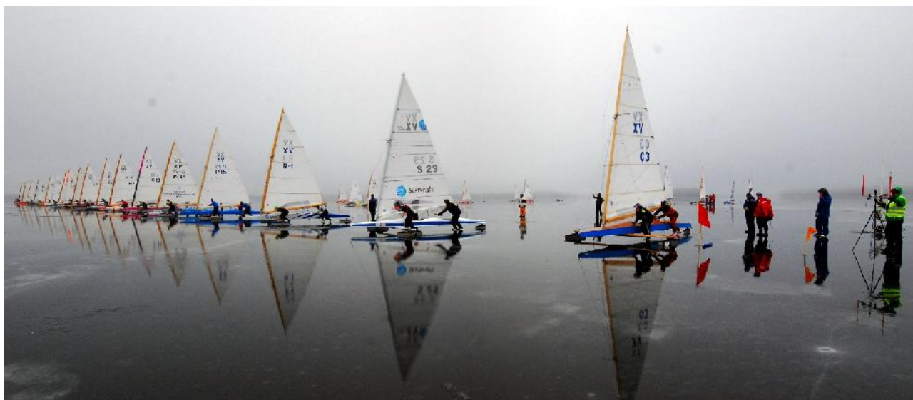
EM på Hjälmaréns is.

I samband med EM fick vi fin täckning i lokala media i Södermanland, både dagstidningar, lokal-TV och Sörmlandsnytt.