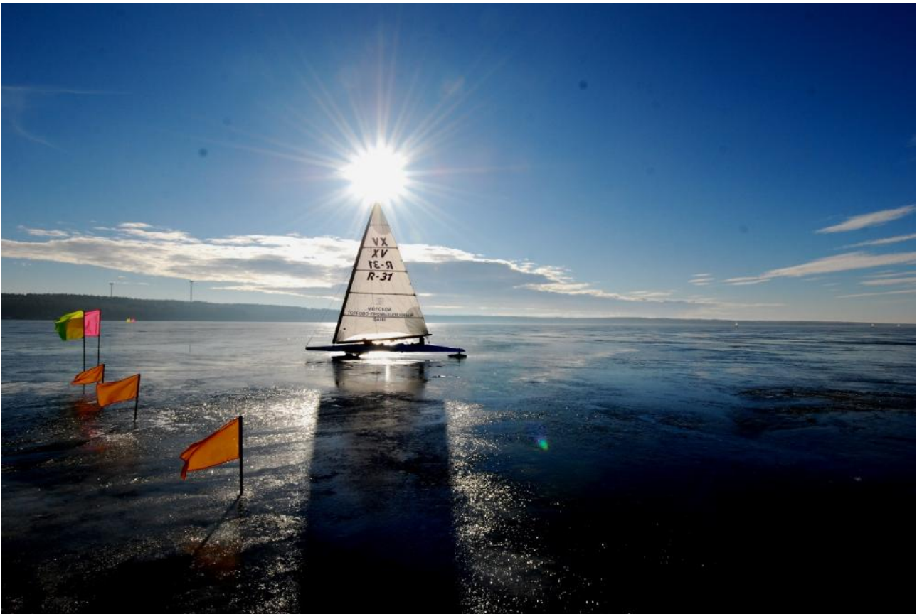
EM: Två dagar av fem gick att kappsegla. Vädret var tidvis strålande.